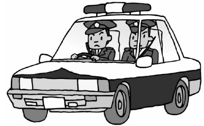
特殊詐欺の認知件数と被害金額